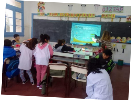
Imágen 6. Estudiantes de veterinaria durante las visitas a escuelas primaria y secundarias de Tandil.