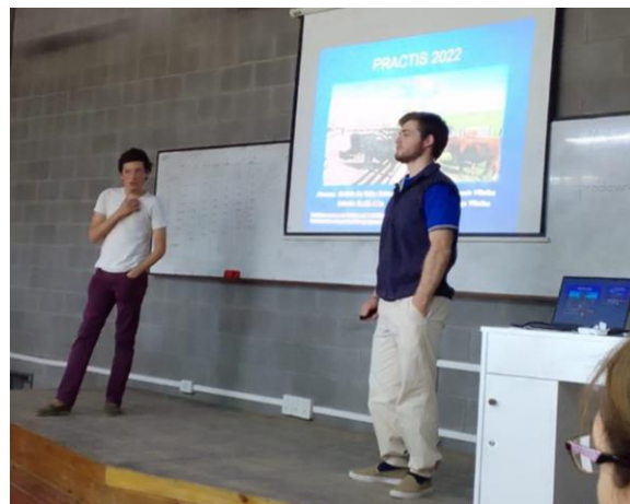
Imágen 1. Estudiantes de 2do año de veterinaria presentando su experiencia en establecimientos rurales, PracTIs II.

Las PracTIs II se realizaron en el marco de la asignatura Introducción a la Producción Agropecuaria de 2do año . Los/as estudiantes se organizaron en grupos de 7 a 10 y se asignó un tutor o tutora profesional vinculado a la FCV para realizar visitas a establecimientos rurales. Allí realizaron prácticas a campo, observaciones y consultas acerca del trabajo y la interacción con actores rurales del/la profesional. De manera optativa presentaron oralmente la experiencia a lo largo de la cursada. Como preparación áulica se ofrecieron contenidos teóricos y herramientas para la comunicación analógica y digital y la gestión de reacciones emocionales. Este año 49 de 80 estudiantes totales presentaron el informe solicitado por el equipo docente y 16 de ellos/as realizaron la presentación oral de la experiencia. Se prevé continuar con la práctica en esta asignatura durante el 2023 con algunas modificaciones que permitan un mayor aprovechamiento de la misma, articulando la experiencia de cada estudiante con el contenido teórico disciplinar y mayor profundidad de análisis del contexto.