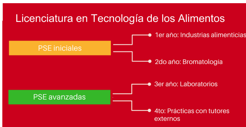
Ilustración 2. Trayecto Formativo Transversal de Profesionalidad, Licenciatura en Tecnología de los Alimentos.

En la carrera de LTA el Trayecto curricular es planificado y puesto a punto conjuntamente a la Comisión de Educación Integral de la LTA y se denomina Trayecto Formativo Transversal de Profesionalidad (TFTP), y responde a la siguiente planificación: