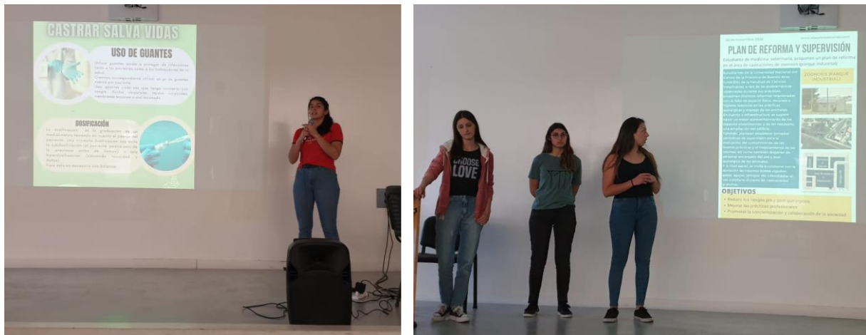
Imágen 3 Infografías de estudiantes de 3er año de veterinaria, PractIs III.