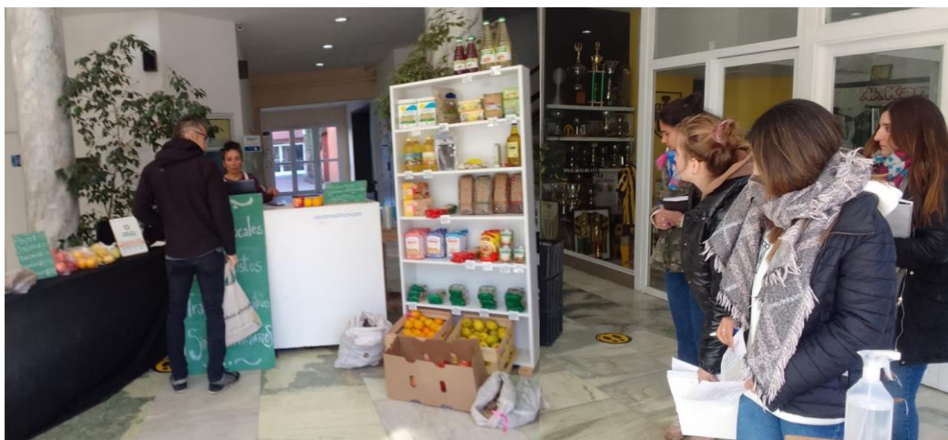
Imágen 5. Estudiantes de licenciatura realizando prácticas observacionales durante el funcionamiento del espacio “ConSuma Dignidad”, PIES, UNICEN.

“CatedraCoop”. Esta vinculación dio la posibilidad de realizar intervenciones prácticas en el Centro Cultural “La Compañía” y las instalaciones del Centro Cultural Universitario (CCU) donde funciona el proyecto “ConSuma Dignidad” por parte de los/as estudiantes.