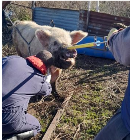
Imágen 7. Estudiantes de veterinarias durante las visitas a pequeños productores porcinos.