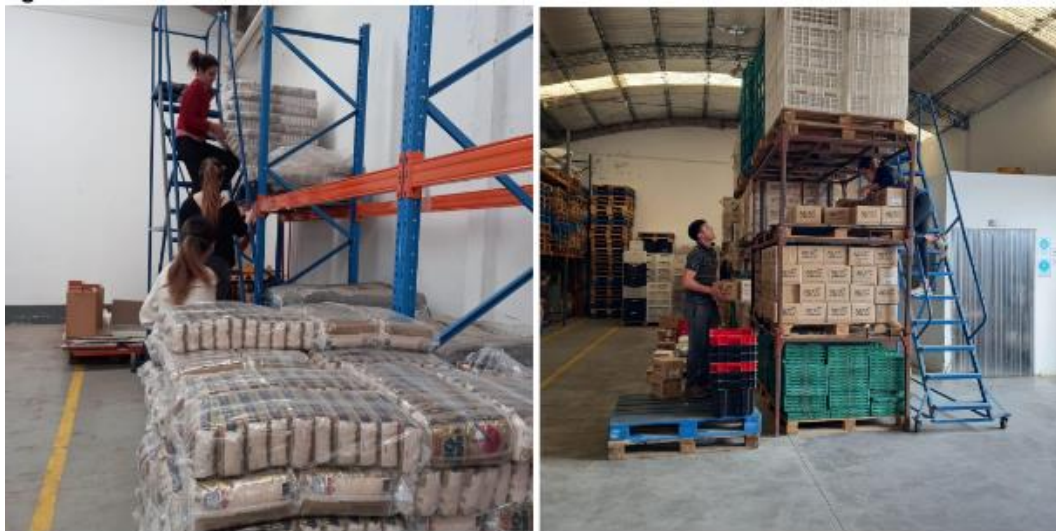
Imágen 8. Estudiantes de licenciatura en actividades dentro del BAT.

Otro proyecto de PSE que comenzó a gestarse es en vinculación con el Banco de Alimentos Tandil (BAT) para realizar diversas actividades de voluntariado como primeras experiencias en el ámbito profesional. Participaron estudiantes de 1ro, 2do y 4to año de la LTA y las tareas se relacionaron con las buenas prácticas higiénicas, manipulación de los alimentos, manejo de programas de stock, visitas a comedores y capacitaciones. La actividad les ha permitido conocer el rol social que cumple el BAT en la ciudad, las vinculaciones que tiene esta institución con distintas empresas alimenticias y su rol de intermediario con grupos sociales más vulnerables. Durante el 2023 se trabajará en fortalecer el proceso de enseñanza aprendizaje relacionado a lo social que surge en el contexto del BAT.