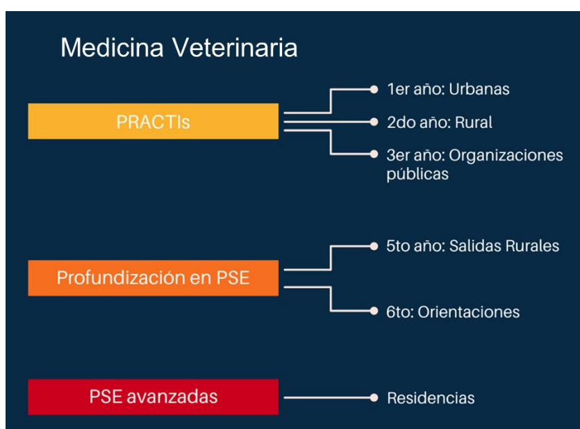
Ilustración 1. Trayecto Formativo en PSE, Medicina Veterinaria.

En la carrera de MV las prácticas curriculares están en línea con el Trayecto de Profesionalidad Médica según la siguiente planificación: