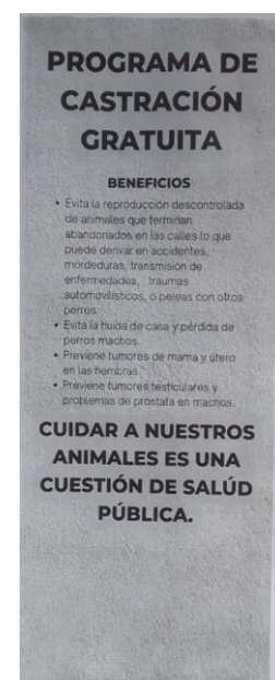
Imágen 2. Stand de estudiantes de 3er año de veterinaria presentando folleto informativo dirigido a la comunidad, PracTIs III.