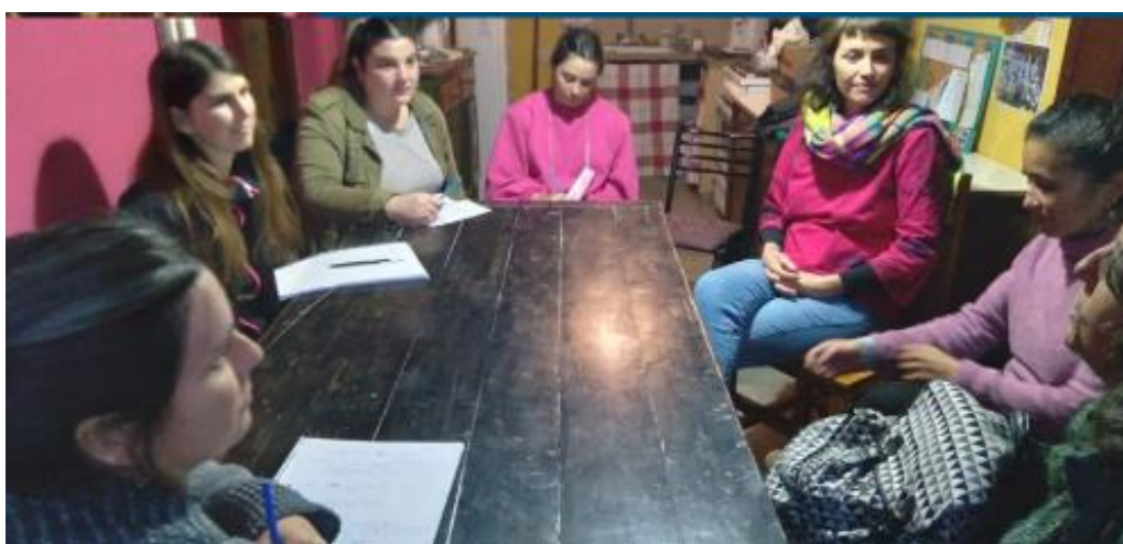
Imágen 4. Estudiantes de licenciatura realizando entrevista a usuarias de la cocina comunitaria del Centro Cultural “La Compañía”.